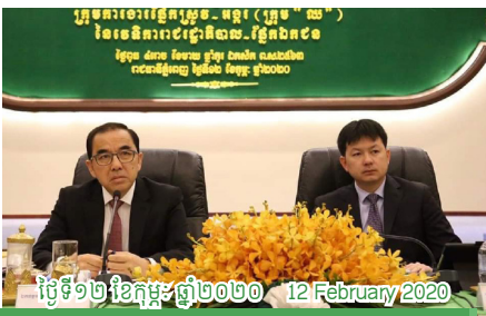
ថ្ងៃទី១២ ខែកុម្ភៈ ឆ្នាំ២០២០ 12 February 2020

សហព័ន្ធស្រូវអង្ករកម្ពុជា ចូលរួមក្នុងកិច្ចប្រជុំក្រុមការងារ ផ្នែកស្រូវ-អង្ករ (ក្រុម "ឈ") នៅទីស្តីការក្រសួងកសិកម្ម រុក្ខាប្រមាញ់ និងនេសាទ CRF participated in the official meeting of Rice working group at the the Ministry of Agriculture, Forestry and Fisheries (MAFF)