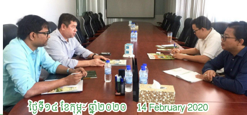
ថ្ងៃទី១៤ ខែកុម្ភៈ ឆ្នាំ២០២០ 14 February 2020

កិច្ចប្រជុំជាមួយ ស.អ.ក និង អង្គការស្រៀងអាហារពិភពលោក (WFP) ស្នើឲ្យមានការ សហការលើការផលិតអង្ករដែលមានវិធានមាំមួន (Fortified rice) CRF meets with World Food Program (WFP) on the suggested collaboration of fortified rice producing