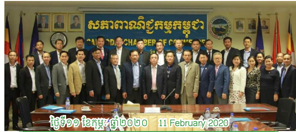
ថ្ងៃទី១១ ខែកុម្ភៈ ឆ្នាំ២០២០ 11 February 2020

កិច្ចប្រជុំប្រមូលធាតុចូលអំពីបញ្ហាប្រឈមនិងសំណើនានាពីគ្រប់ ភាគីពាក់ព័ន្ធក្នុងវិស័យស្រូវអង្ករ ដើម្បីត្រៀមលើកឡើងកិច្ចប្រជុំ "ក្រុមការងារផ្នែកស្រូវ-អង្ករ" ជាមួយនិងក្រសួងកសិកម្ម រុក្ខាប្រមាញ់ និងនេសាទ Meeting about inputs collections from all related stakeholders in rice sector specifically on problems and suggestions to prepare for the meeting with the Ministry of Agriculture, Forestry and Fisheries (MAFF), moving forward for preparing to the up-coming Government-Private sector forum in April 2020