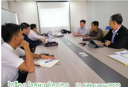
ថ្ងៃទី១០ ខែកុម្ភៈ ឆ្នាំ២០២០ 10 February 2020

កិច្ចប្រជុំលើកទីមួយ គណៈកម្មាធិការប្រតិបត្តិផ្នែកផ្លែដើម និង សហគមន៍ រោងម៉ាស៊ីនគ្រឿងស្រូវ ពិភាក្សាលើសមភាពគណៈកម្មាធិការ និងការងារសំរាប់រយៈពេលខាងមុខ និងកំណត់បញ្ជី ដើម្បីស្វែងរកដំណោះស្រាយ First meeting of the Cost Competitiveness and Rice Miller, Community Executive Committee (ExCo 4) discussing on the role of committee and the future workplan as well as notify the problems and solutions