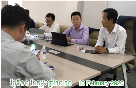
ថ្ងៃទី១០ ខែកុម្ភៈ ឆ្នាំ២០២០ 10 February 2020

កិច្ចប្រជុំលើកទីមួយ គណៈកម្មាធិការប្រតិបត្តិផ្នែកផ្លែដើម និង សហគមន៍ រោងម៉ាស៊ីនគ្រឿងស្រូវ ពិភាក្សាលើសមភាពគណៈកម្មាធិការ និងការងារសំរាប់រយៈពេលខាងមុខ និងកំណត់បញ្ជី ដើម្បីស្វែងរកដំណោះស្រាយ First meeting of the Cost Competitiveness and Rice Miller, Community Executive Committee (ExCo 4) discussing on the role of committee and the future workplan as well as notify the problems and solutions