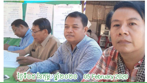
ថ្ងៃទី០៥ ខែកុម្ភៈ ឆ្នាំ២០២០ 05 February 2020

កិច្ចប្រជុំជាមួយ ស.អ.ក និង អង្គការស្រៀងអាហារពិភពលោក (WFP) ស្នើឲ្យមានការ សហការលើការផលិតអង្ករដែលមានវិធានមាំមួន (Fortified rice) CRF meets with World Food Program (WFP) on the suggested collaboration of fortified rice producing